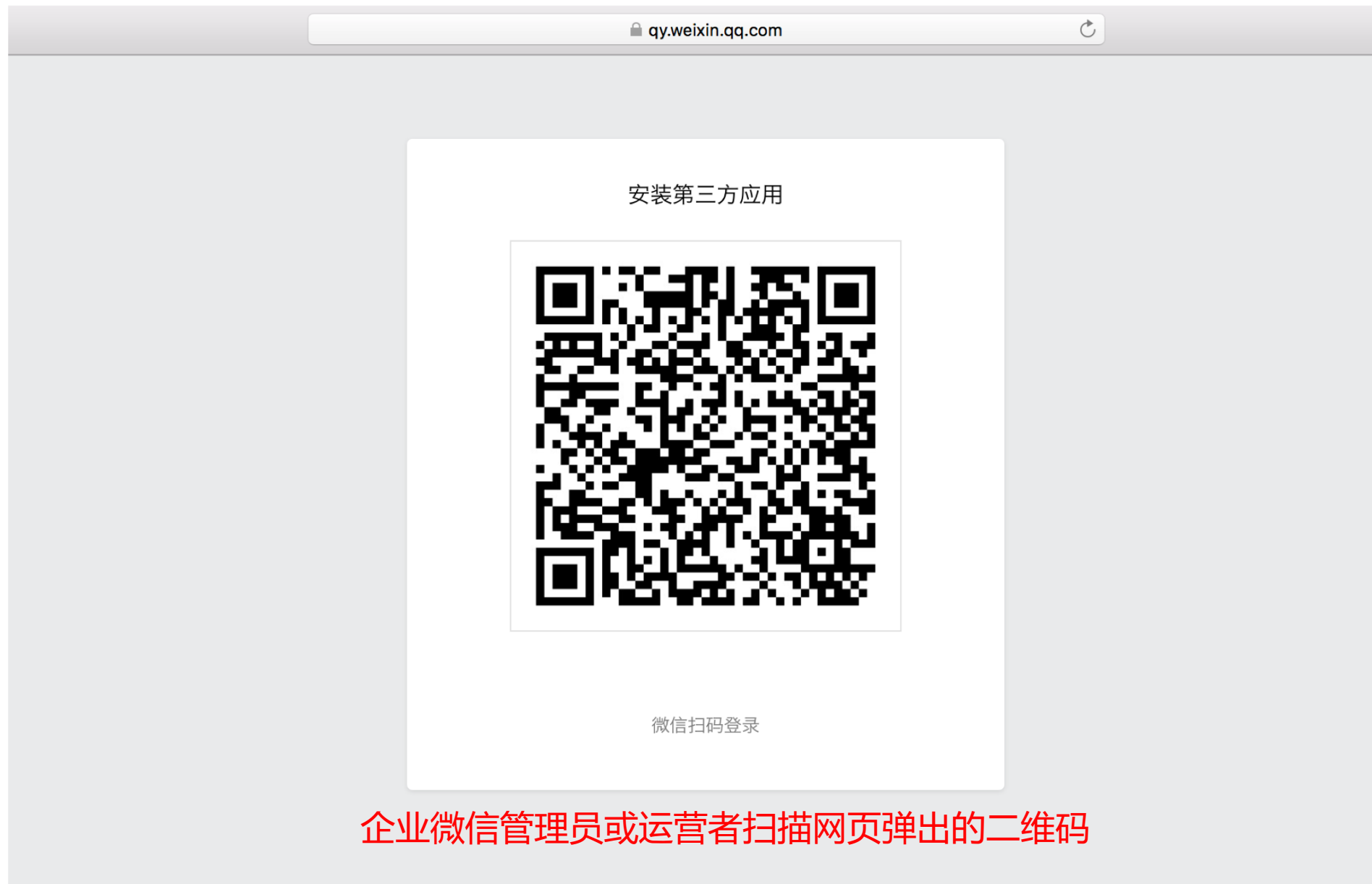
企业微信管理员或运营者扫描网页弹出的二维码